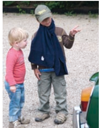
Volgens mij probeert Max z'n zoon hier uit te leggen wat een Karmann is...

Een prachtige dag, een prima route en een zeer goed diner. Een grote pluim aan de organisatie!