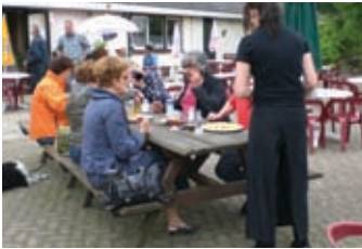
En waar krijg je dat slanke figuur van? Inderdaad, van de lekkere pannenkoeken!

een pannenkoek. Onder het genot van een drankje, een heerlijke pannenkoek en vele (sterke) verhalen, verlieten we na ongeveer een uurtje het restaurant, om de route weer te vervolgen. Via Horst en Dieren reden we richting De Steeg. Kort daarna reden we, via een parkeerplaats, de Posbank op, een prachtige route die heerlijk is om te rijden. Daar het niet zo heel zonnig was, kwamen we gelukkig niet al te veel fietsers en voetgangers tegen. We konden dus gestaag door rijden en hadden geen problemen met de vele MG's die ons tegemoet kwamen. Onderweg zijn we nog even gestopt om van het prachtige uitzicht te genieten en hebben we nog een kleine wandeling gemaakt over de heide. We vervolgden onze weg richting het laatste stoppunt voor een bezoek aan de uitkijktoren