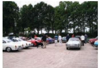
Langzaam stroomde het parkeerterrein weer vol met KG's.

Als afsluiting kregen we nog een kopje koffie en zo rond de klok van 20.30 uur zijn we weer naar huis gereden.