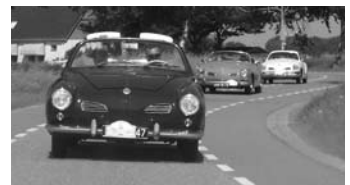
Een mooie sliert KG's!