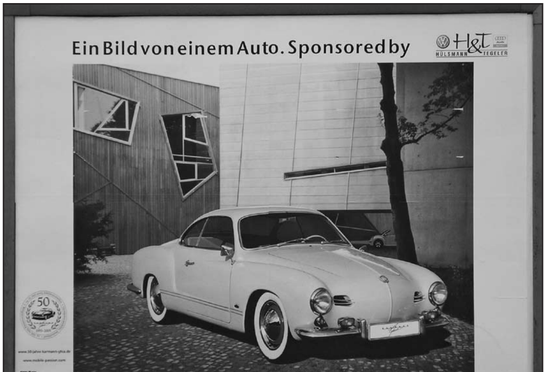
De eerste productieversie van de Karmann Ghia zoals die nu in het Karmann-museum te zien is.