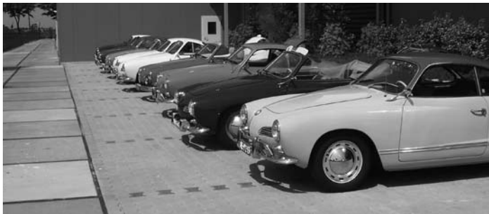
De deelnemende auto's

hier ook telkens, waarna de passagiers werden gewisseld. De tocht was ongeveer 20 km lang en werd 3x gereden. De kinderen kregen een vragenlijst mee, waarvan ze de antwoorden tijdens de tocht moesten proberen te vinden. De kinderen die achterbleven konden in de dieren-tuin rondkijken en ook daar