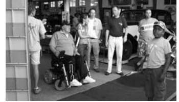
De eigenaar/verzamelaar in de rolstoel gezeten, met een onuitputtelijke hoeveelheid anecdotes.

beschikking gesteld aan de kinderen. Door het succes van deze dag is unaniem besloten dat een