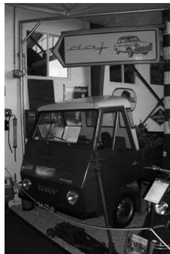
De DAF Pony en de wegwijzer naar het speciale DAF-hoekje.

bestelwagentje, op basis van het beroemde DAF-aandrijfconcept. De eigenaar/verzamelaar is een kleurrijk persoon en kon van