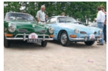
Beide Karmanns zijn overgangstypes:

We vervolgden onze weg richting Otterloo en vervolgens richting Loenen. Daarna richting Klarenbeek en ergens halverwege hebben we een tussenstop gemaakt om wat te eten bij een pannenkoekenrestaurant. De gehele colonne van Karmanns reed de parkeerplaats op en bij het uitstappen constateerden we dat er al enige andere Karmanns stonden. We besloten binnen wat te gaan eten en we sloten bij elkaar aan, aan een grote tafel. De serveerster kwam onze bestelling opnemen en vroeg enigszins bezorgd of er nog meer mensen kwamen van de club. We vertelden dat dit zomaar zou kunnen en 20 minuten later