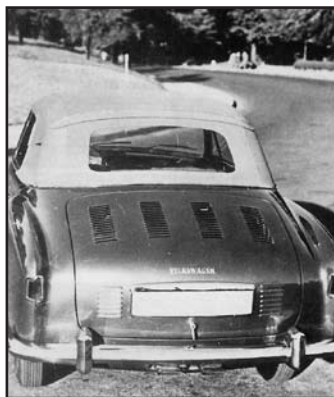
Achterzijde van deze 1 e proto

Deze foto laat de achterzijde van de auto zien met daarin de louvres voor de motorkoeling.