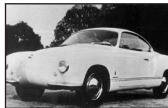
Proto nummer 2.

De Karmann die tijdens het 50-jarig jubileum tentoongesteld is, is er één van de eerste pro-