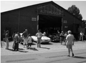
Het automuseum in Schagen

ken door het Noord-Hollandse landschap. Onderweg werd het plaatsje Schagen aangedaan waar een klein automuseum, speciaal voor deze gelegenheid, geopend was. De meesten van ons kenden dit museum nog