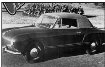
Proto nummer 1

Ik kon me herinneren dat ik een artikel had gelezen over de eerste Karmann Ghia-protos. Maar dan is altijd weer de vraag: waar stond dat ook alweer? Gelukkig kon ik mij herinneren dat het in een tijdschrift stond, alleen: in mijn 2 meter-archief van allerhande (buitenlands) VW-bladen is het niet zo gemakkelijk om zo'n artikel even snel terug te vinden. Tijdens mijn laatste opruimsessie in huis kwam ik zowaar een leuk artikel tegen van Keith Seume in de Volksworld. Wellicht dat mensen onder jullie hem kennen van diverse publicaties over speciale VW's en Porsches. Dit artikel betrof de foto's van de eerste proto's van de Karmann Ghia Type 14. In hoeverre dit dan echt de eerste proto is blijft altijd weer enigszins gissen, want over de historie van Karmann blijken net zoveel varianten te zijn als dat er auto's gebouwd zijn!