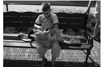
Deze jongen raakte maar niet uitgepraat over het verrassingspakket!

beschikking gesteld aan de kinderen. Door het succes van deze dag is unaniem besloten dat een