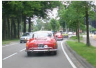
Na het uitbuiken van de pannenkoeken, weer even lekker rijden.

weer in en reden we direct door naar het eindpunt in Ellecom: De Peerdestal.