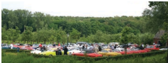
Verzamelen bij kasteel Doorwerth

Na een vlugge blik op de route bleek dat er voldoende stopmomenten waren en dat er genoeg gelegenheid was om