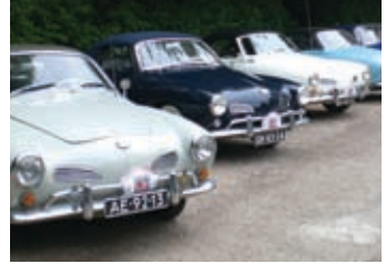
Eindpunt van de rit dus iedereen netjes in het gelid.

Wij hadden ons opgegeven voor het diner en dat was een zeer goede keuze. Anders dan de naam zou kunnen doen vermoeden, kunnen ze hier geweldig goed koken. We kregen eerst een buffet met koude en warme voorgerechten en daarna een buffet met vele verschillende hoofdgerechten, we hebben echt zitten smullen.