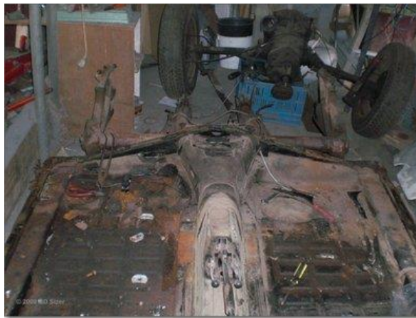
Rechts achter is er het slechts aan toe