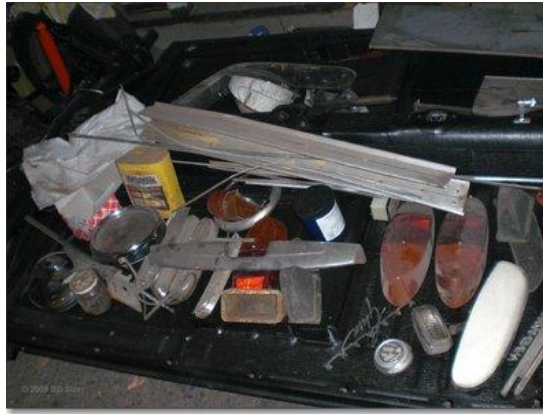
een greep uit het assortiment