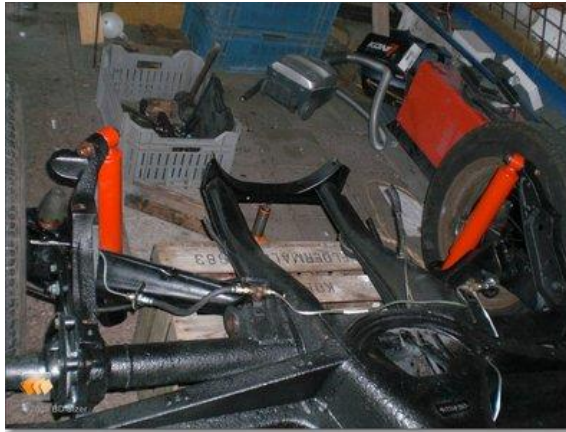
eerst het chassis klaargemaakt