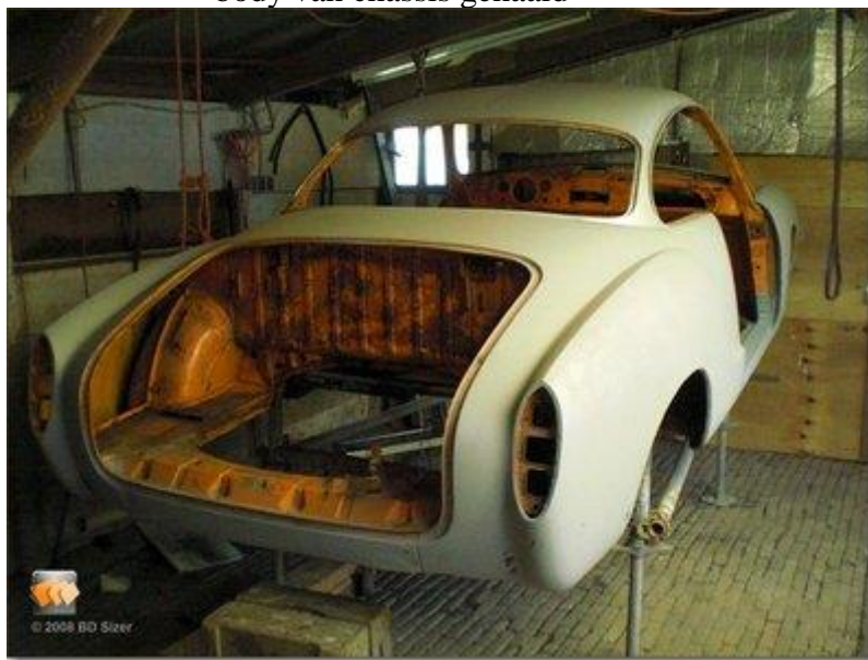
body op bok gezet