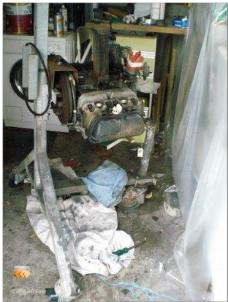
motor op bok

Momenteel staat het stil in hoop dat het weer beter wordt om hem spuitklaar te maken 😊