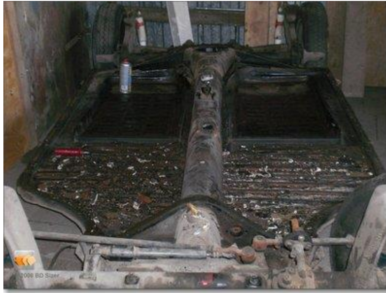
chassis effe oppoetsen