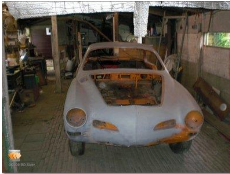
keihard maar niet strak

Deze uit Californië afkomstige Karmann had 8 jaar kaal in een garage gestaan. Ik heb hem toen hij thuis was gelijk in de primer gezet.